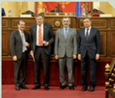
FRANCISCO MANUEL ASÓN PÉREZ Alcalde de Ribamontán al Mar (Cantabria)

«Los Ayuntamientos cada día van a tener un protagonismo más importante porque el ciudadano, el administrado, al primero que va a ver es al Alcalde, después ya vienen las Diputaciones, lo que quiera... Los que estamos en la España más despoblada estamos más cerca del ciudadano y estoy realmente convencido de que al final estos pueblos van a tener cierta recuperación».